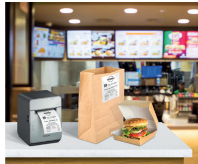
Hôtellerie (restauration rapide)